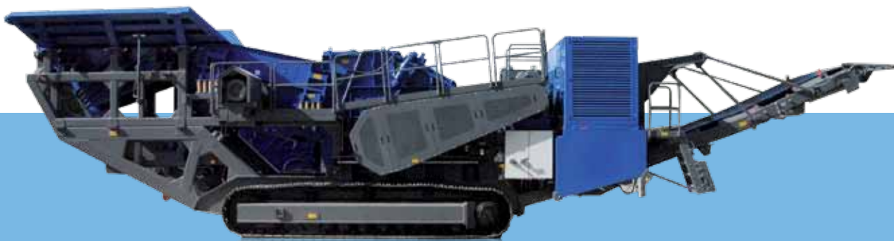
Схема MR 170 Z в рабочем положении